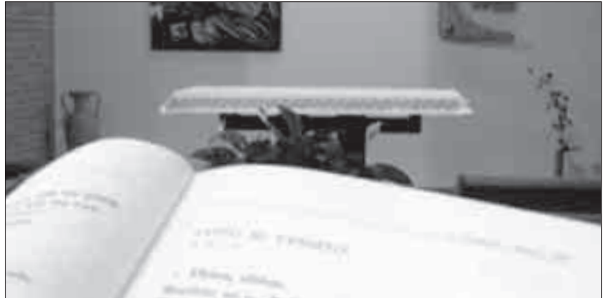
Interno della cappella di "Casa Santa Chiara", da poco ristrutturata (part).