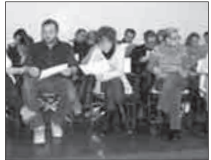
Momenti della formazione nella sala polivalente: ascolto e partecipazione attiva.

MILANI P., IUS M. (a cura di), 2011, Educazione, pentolini e resilienza. Pensieri e pratiche per co-educare nella prospettiva della