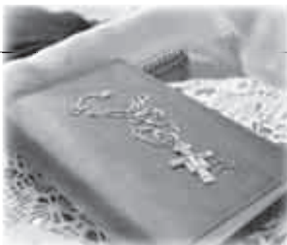
Il nuovo testo di costituzioni (1980), frutto del rinnovamento del dopoconcilio.

Ogni mese una circolare della Superiore generale focalizza aspetti della vita elisabettina illuminati dalla dottrina del Concilio e accompagna un questionario da restituire nel giro di qualche settimana 3 .