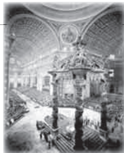
Visione suggestiva su una celebrazione del concilio Vaticano II in San Pietro.

Quindi potremmo dire che la Chiesa – e l'ecclesiologia, di conseguenza, cioè "lo studio della Chiesa" – è sempre "in divenire". La Chiesa è certamente voluta da Dio, fondata da Cristo, animata dallo Spirito. Però