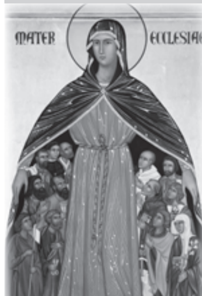
Maria, Mater ecclesiae, icona Atelier iconografico di Bose, 2012.

La Lumen gentium è un documento complesso e ricco di suggestioni. Perciò è da “rivisitare” continuamente, perché non decada a testo letterario, uno fra i tanti. Molteplici sottolineature se ne possono fare. Ne segnalo alcune, qui di seguito. La reintegrazione del mistero della Chiesa nel “contesto generale” della storia della salvezza. La restituzione – alla comunità in quanto tale – dei ruoli e della missione (che una nozione esclusivamente gerarchica della Chiesa riservava solo ad alcuni). L'aspetto sacramentale come carattere primordiale («la Chiesa è in Cristo come sacramento, cioè segno e strumento dell'intima unione con Dio e dell'unità di tutto il genere umano»: LG 1). La riscoperta della “cattolicità” della Chiesa, come “diversità in seno all'unità”. La presa di coscienza della “missione temporale” della Chiesa nel mondo, come condizione della salvezza