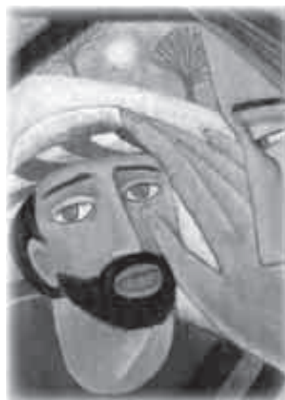
Gesù ha avuto gesti di attenzione per l'uomo, perché potesse aprirsi alla realtà.

Un aspetto che può risultare importante approfondire riguarda l'educazione dei sensi attraverso i canali di comunicazione utilizzando i contributi, relativamente recenti, delle scienze umane che aiutano la persona a conoscere maggiormente se stessa ed a capire come sfruttare al meglio la propria sensorialità. Mi riferisco alla Programmazione Neuro Linguistica che ha approfondito questo argomento in termini statistici e in termini clinici per offrire concrete indicazioni conoscitive ed operative.