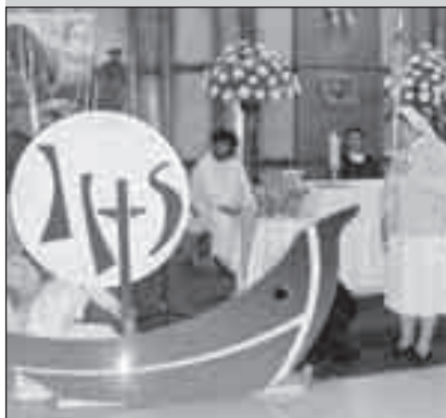
Momenti celebrativi con segni e danze.

Ci sentiamo grate per quanto abbiamo ricevuto in questa settimana. Speriamo di riuscire a contagiare le nostre comunità, divenendo noi stesse segni concreti di allegria, di profezia in mezzo ai nostri fratelli e sorelle, soprattutto lì dove la vita è minacciata. ■