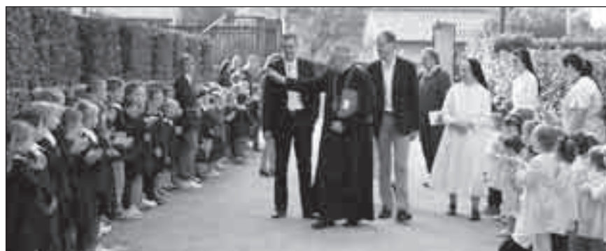
Incontro del Vescovo con bambini e docenti della scuola dell'infanzia e della primaria.

La visita è terminata con un caloroso applauso, segno di ringraziamento per le "belle parole" e gli insegnamenti dati a tutti i presenti, grandi e piccini. È stata una bella esperienza, vissuta da tutti in modo intenso.