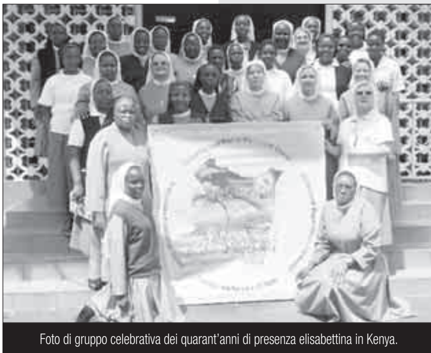
Foto di gruppo celebrativa dei quarant'anni di presenza elisabettina in Kenya.