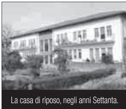
La casa di riposo, negli anni Settanta.

Il ritiro della comunità presso la casa di riposo di San Vito al Tagliamento, punto di arrivo di un accurato discernimento, lascia un vuoto ma anche una eredità di stile di vita.