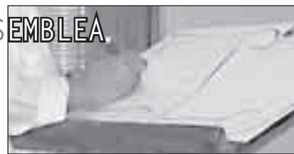
Il credo della superiora.

La bussola era accompagnata da queste parole della nostra Madre Fondatrice: «Mai cessate di mirare il vero Sole di giustizia e di adorare, riverenti, quell'adorabile volontà della quale vi vorrei pazze, piene e ripiene e sovrappiene» Istr. 15,2. ■