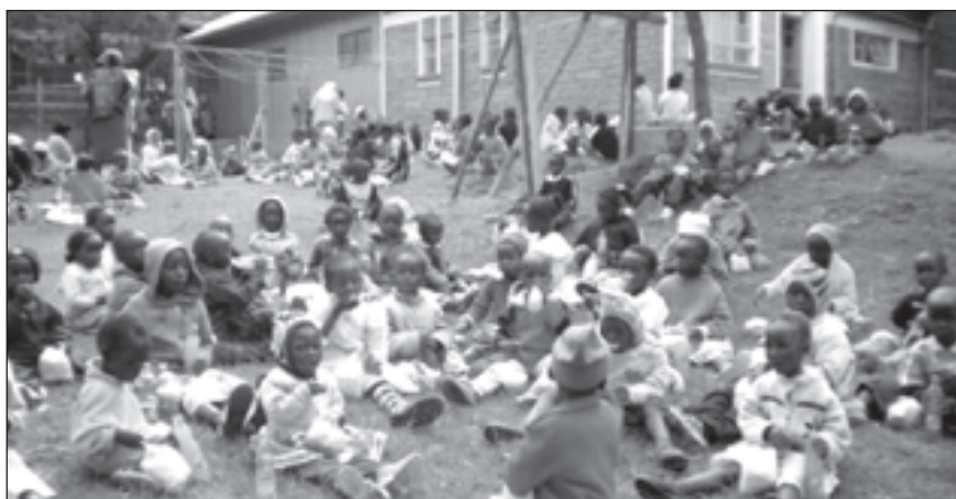
Momenti di gioia per grandi e piccoli al fun day .