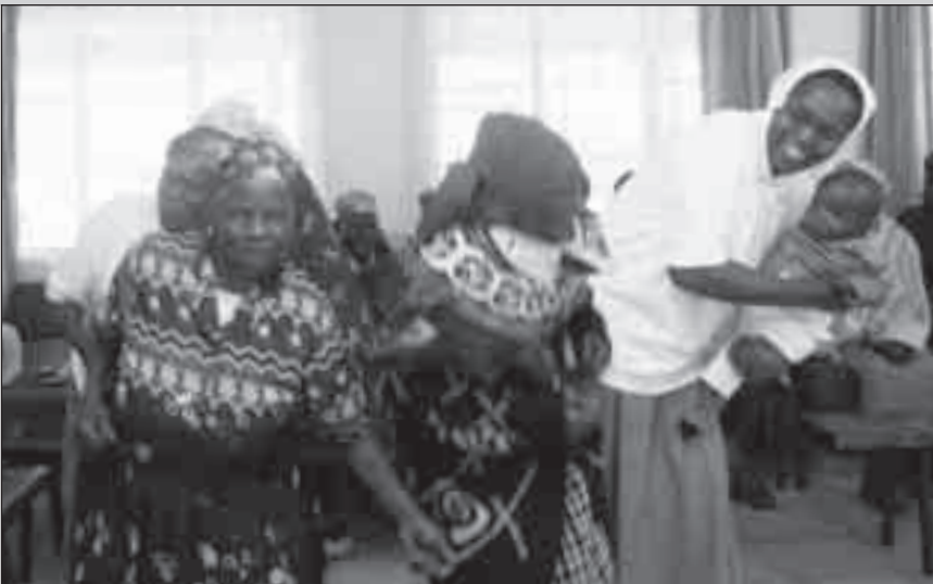
Il pranzo di Natale, festa di condivisione anche attraverso la danza.

Questo Natale ha illuminato i volti di persone – anziani, ragazzi, ragazze e bambini orfani – povere e abbandonate. Noi postulanti ci sentiamo felici e gioiose per aver celebrato la nascita di Gesù nella condivisione in comunità. ■