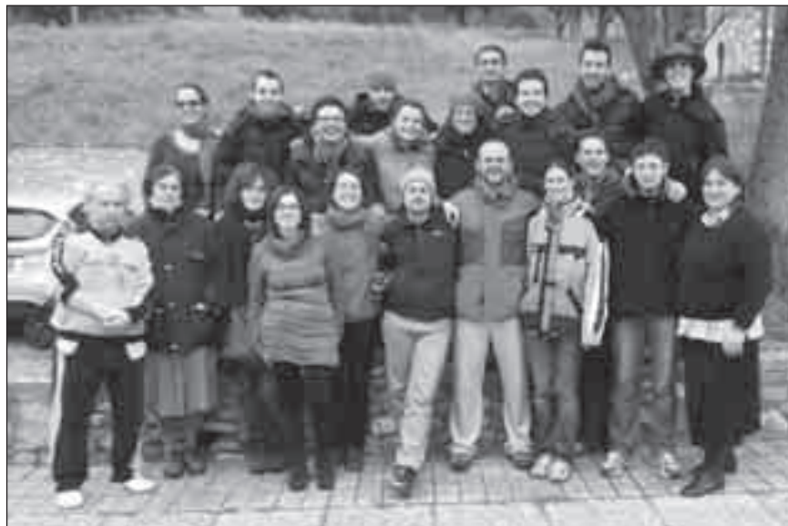
Foto di gruppo dei partecipanti all'esperienza. Sotto: momento di preghiera.