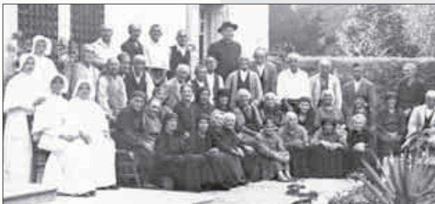
Gli ospiti, le suore e il personale della casa di riposo di San Vito al T. agli inizi degli anni Cinquanta.

Alle suore il Consiglio di amministrazione ha donato una targa-ricordo con un segno di riconoscenza per la Casa generalizia; gli ospiti e il per-