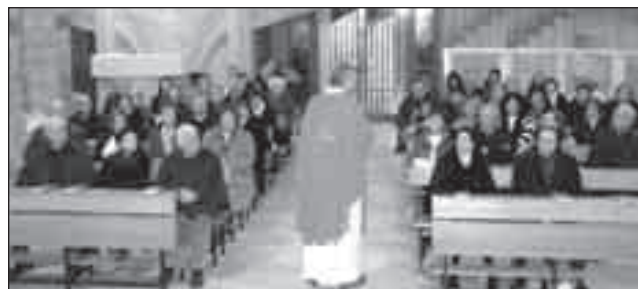
Celebrazione eucaristica durante un percorso formativo, all'OPSA.

Ho sempre visto l'Associazione come una "sovrastruttura" con dentro delle