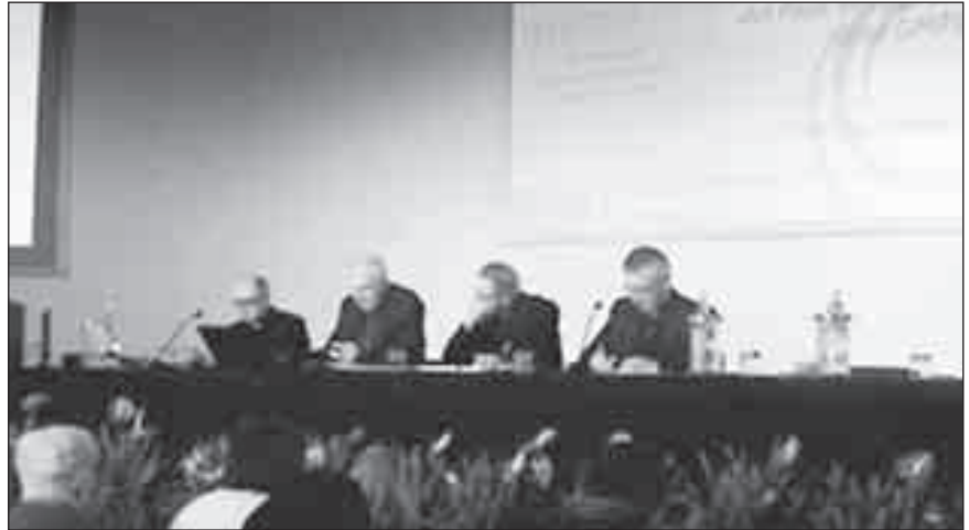
Il senso della vita si comprende accogliendo il Signore che è il fine che orienta il nostro cammino: momento della tavola rotonda al Convegno nazionale per gli operatori di pastorale delle vocazioni.

Monsignor Forte ha concluso sottolineando come la pastorale giovanile e la pastorale vocazionale siano tra di loro strettamente collegate: bisogna suscitare in ogni giovane la certezza che il senso vero della vita si comprende solo accogliendo il Signore che è la