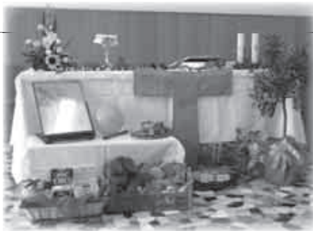
Anche una celebrazione eucaristica può diventare occasione di educazione alla condivisione con chi ha meno ( Casa dei Bambini - Trieste, 2013 ).

3) Un riferimento persino più forte per ripensare il tema del consumo possiamo trovarlo nell'eucaristia: essa inserisce il gesto del mangiare nello spazio della salvezza, raccogliendolo attorno ad una dinamica di comunione. L'eucaristia ricorda che nulla deve andare sprecato: il cibo è sempre espressione di una dinamica orientata alla vita, che nasce però da un dono fondante, oneroso. Essa rimanda a quei testi biblici - come Is 25, 6-9 - che descrivono il