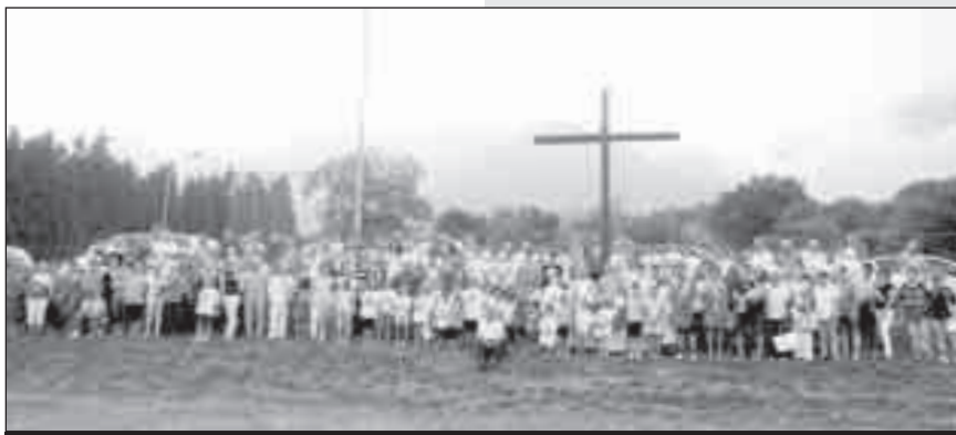
Conclusione del grest a Fietta, anche intorno alla "Croce della gioventù".