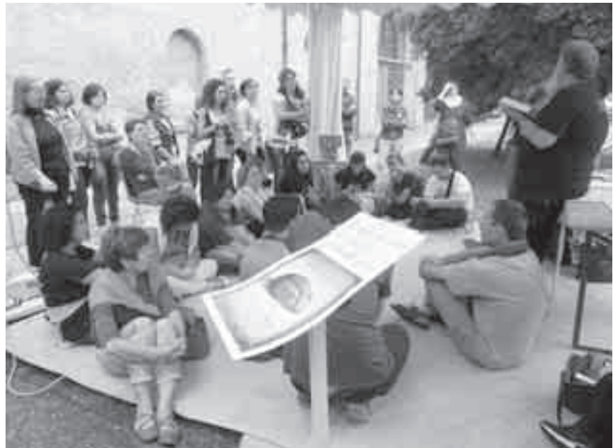
Andate, non abbiate paura di raccontare l'amore di Dio Padre.

La crisi economica e del lavoro, invece che generare paura per un sistema che crolla, può diventare una