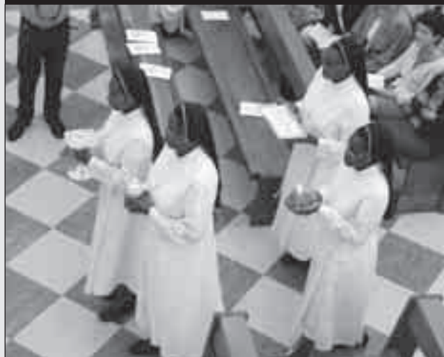
Dopo l'offerta di sé, i doni per il sacrificio.