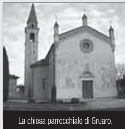
La chiesa parrocchiale di Guaro.