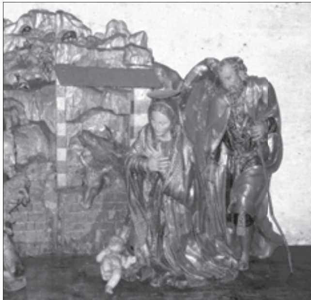
In copertina: Giovanni Angelo del Maino (XVI secolo), Natività , part., scultura in legno policromo, sacrestia della Collegiata di San Martino, Treviglio - Bergamo, p.gc.