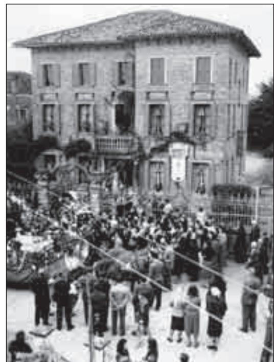
Avvio della processione della Madonna Pellegrina dall’asilo, 1951.

Il 12 settembre 1955 il Vescovo risponde monsignor molto spiacente per