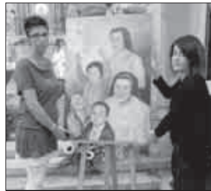
Il quadro che ricorda la presenza elisabettina nella comunità di Aviano.