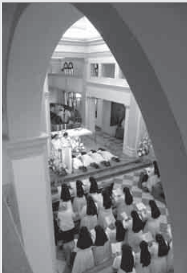
Prima dell'emissione dei voti la Chiesa riunita invoca l'intercessione dei santi sulle candidate, prostrate a terra.