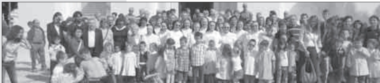
E, dopo la messa, la foto ricordo davanti alla chiesa.

La comunità ha presentato quindi un quadro ( nella foto sopra ), opera di una pittrice locale, che raffigura un momento della vita della scuola, e che verrà appeso in una delle pareti della scuola dell'infanzia: esso ricorda la