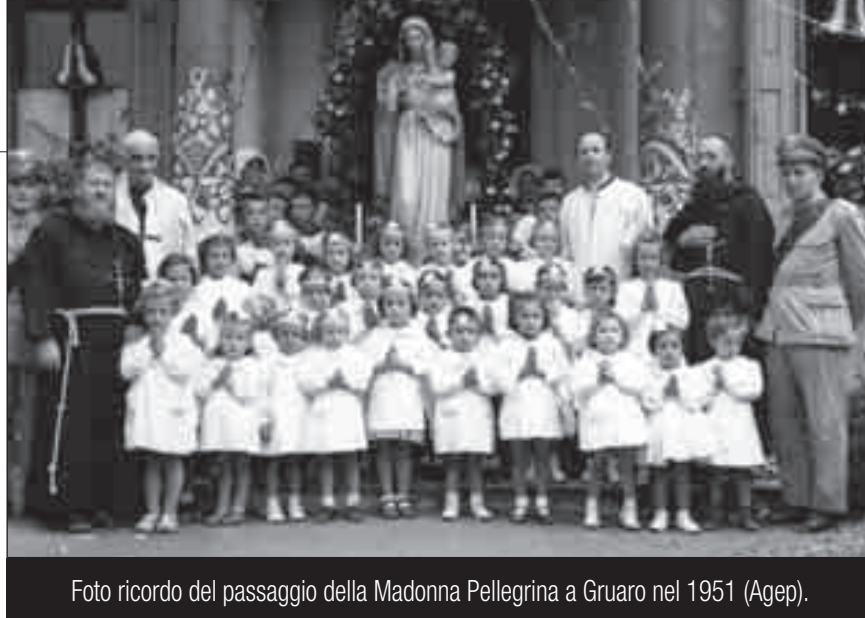
Foto ricordo del passaggio della Madonna Pellegrina a Gruaro nel 1951.

di età dai 3 ai 6 anni e di provvedere alla loro educazione religiosa e morale, intellettuale e fisica nei limiti consentiti dalla loro età.