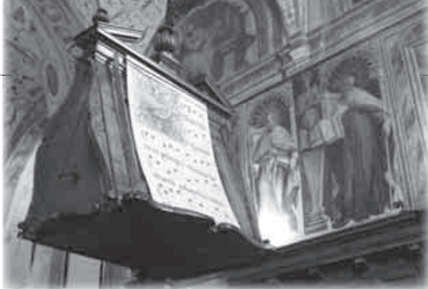
La Parola al centro della vita della Chiesa, anche visibilmente: Evangelario dell'Abbazia di Santa Maria di Farfa - Rieti.

che va letta e interpretata la Scrittura, perché Lui conduce nella conoscenza della verità intera.