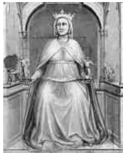
Giotto, La giustizia , Padova, cappella degli Scrovegni, Le virtù e i vizi.

Ciò si fonda evidentemente nel modo che tutto l’Antico Testamento ha di intendere la giustizia di Dio: come la sua fedeltà all’amore verso l’uomo , che ha come paradigma fondamentale l’agire misericordioso e fedele di Dio nella storia. Agire che si manifesta in modo tutto particolare come difesa dei diritti dei poveri. Il testo di Isaia che abbiamo letto ci dice proprio questo: si fa riferimento al manto della giustizia, al germogliare della giustizia, dopo aver annunciato che lo Spirito del Signore è venuto a consolare i miseri, a liberare gli schiavi, a scarcerare i prigionieri. In altre pagine della Scrittura la giustizia è associata alla