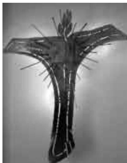
La croce, là dove cresce la vita. Tabernacolo della cappella del convento di Rivotorto, Assisi.

Ma sento che a darmi e darci una risposta in quest'anno è il cuore stesso di san Paolo , che ci illustra con rapide pennellate di colore proprio la dimensione della croce .