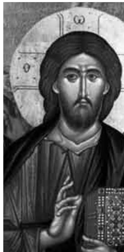
Icona di Cristo pantocratore, monastero di Chelandari, monte Athos, 1260-70 ca.

Aldilà e oltre le icone, la Chiesa venera la presenza e il volto del Signore