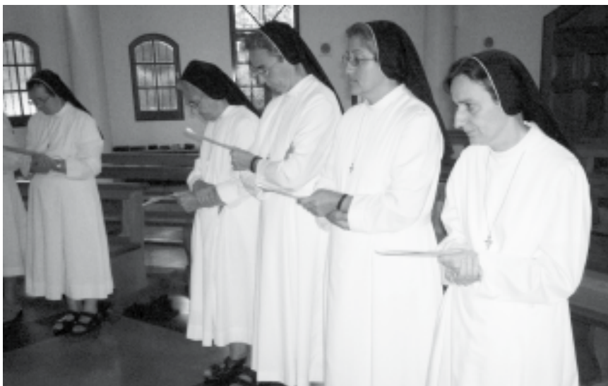
Momento della preghiera di apertura in cappella.

Nell'incontro abbiamo vissuto momenti significativi di riflessione, che hanno alimentato la nostra vita