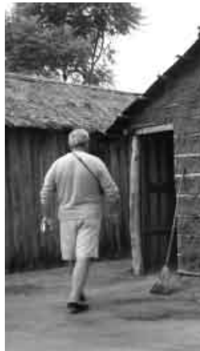
Il cammino della missione, di casa in casa, a portare la Parola di Gesù. Sopra: l'ingresso in una casa.

Le missioni servono per stimolare la missionarietà delle persone impegnate e ridestare una fede che è molto