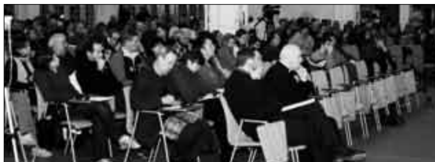
Scorcio sull'assemblea durante l'agorà giovani. Foto di pagina accanto: gruppi tematici di approfondimento.

In un reciproco ascolto giovani e adulti della chiesa di Trieste si intrattengono per riscoprire la tradizione dei valori e dei significati.