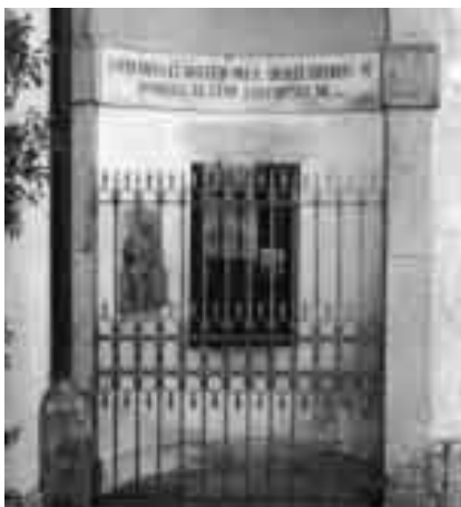
Padova, Istituto degli esposti, la ruota.