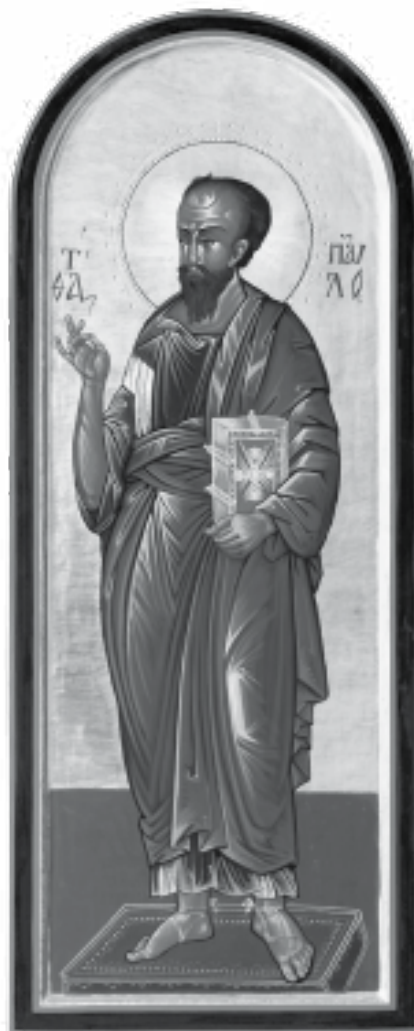
Paolo apostolo, icona scritta da suor M. Pacis Huh pdm, cappella delle Pie Discepolo del Divin Maestro, Firenze.

Ma se non sai intravedere la croce, ecco che anche il tuo apostolato non si fa oblazione, ma orgoglio personale,