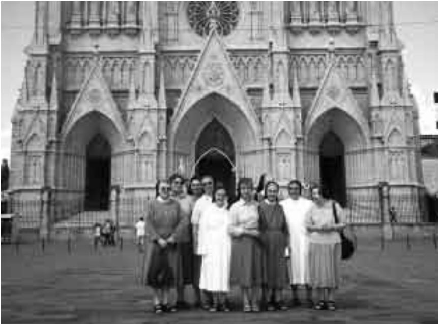
In pellegrinaggio al santuario della vergine di Lujan.

za libera e liberante... un uomo libero e umile, di grandezza insuperabile. Il "sogno" è il genere letterario che esprime la ricerca di Giuseppe: dentro vi legge la volontà di Dio e la compie. Il Verbo eterno di Dio è entrato nella storia umana per il "Sì" di due cuori, e noi entriamo nella storia divina per il "Sì" di Giuseppe. L'obbedienza ci pone nella storia di salvezza, storia scritta da Dio: per questo dobbiamo leggere la storia con gli occhi di Dio... leggere il kairòs nel kronos.