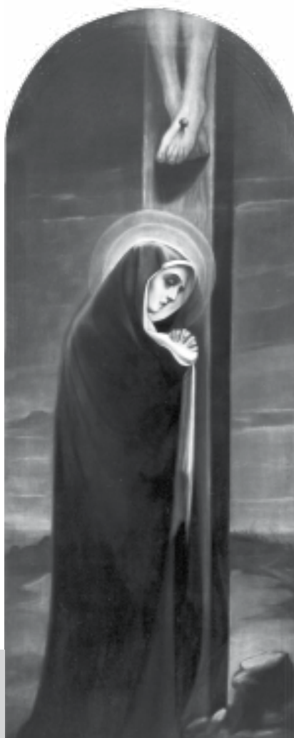
L'addolorata , olio su tela, Casa generalizia suore terziarie francescane elisabettine, Padova.

Quale antidoto? Paolo stesso ce lo mostra con chiarezza nel famoso inno cristologico descritto in Filippesi