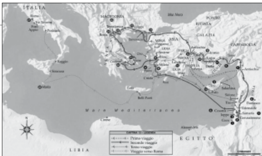
I viaggi di Paolo, instancabile banditore della croce di Cristo, salvezza dell'uomo, sospinto dalla forza dello Spirito.

2,6-11: umiltà nello scendere, per risalire insieme nella logica della carità. In dieci gradini, che sono gli stessi dei gesti di Cristo che lava i piedi e quelli compiuti dal Buon Samaritano. Sempre gesti di umiltà, per avere gli stessi sentimenti del Cristo, crocifisso e risorto!