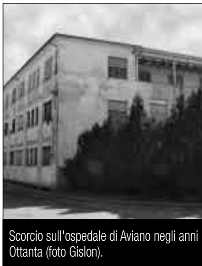
Scorcio sull'ospedale di Aviano negli anni Ottanta.

«... venuti a conoscenza della sua decisione [...] esprimiamo tutto il nostro dispiacere. Non siamo in grado, né ci permettiamo di valutare i motivi che l'hanno spinta ad una simile decisione: solo vorremmo far presente le conseguenze di ordine pastorale derivanti da tale provvedimento. Le suore dell'ospedale di Aviano, sono stimite, ben volute ed apprezzate da